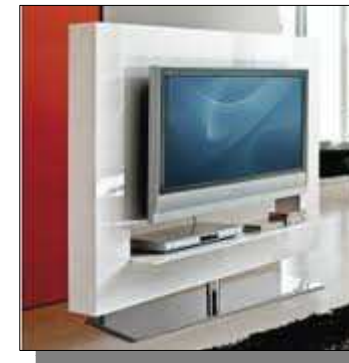
Il porta TV girevole di "Buy - Design"

Di seguito Le propongo alcune tipologie di noti produttori.