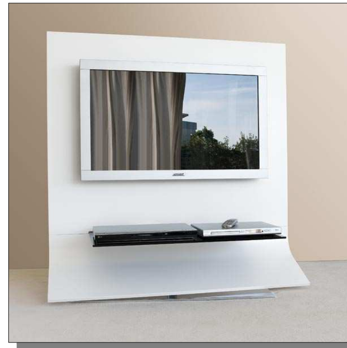
Il porta TV girevole di "Gamma of Venice"