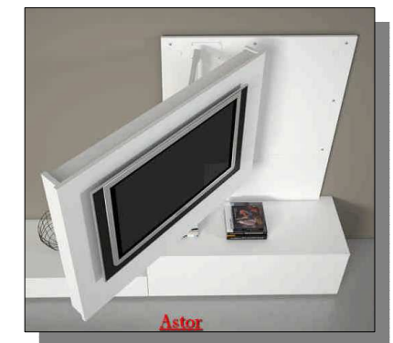
Il porta TV girevole di "Astor Mobili"