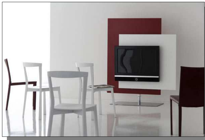
Il porta TV girevole di "Gamma of Venice" (L:140cm)