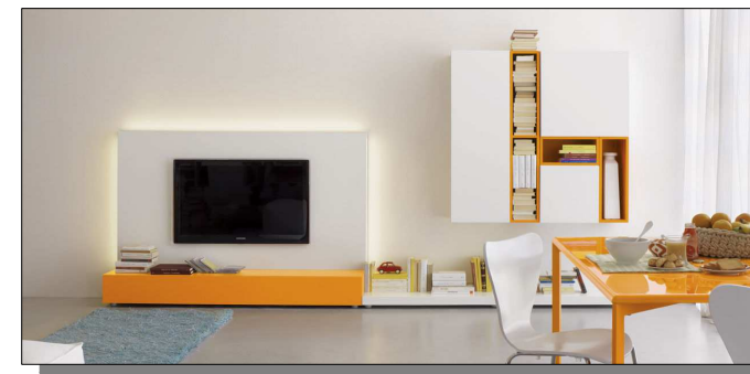
Il porta TV fisso di "Olivieri" (Pur essendo una soluzione a pannello fisso l'ho inclusa esclusivamente per gusto personale, data l'affinità di stile con il Suo soggiorno)