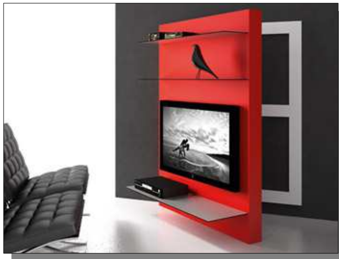
Il porta TV girevole di "Gamma of Venice"